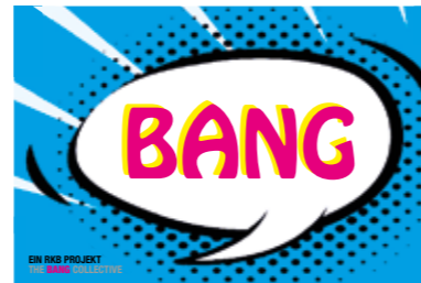
André Yuen, Konzept „THE BANG COLLECTIVE“

Gewachsene Vielfalt: Im September 1949 wurde der Verein - Ruhrländischer Künstlerbund - gegründet. Ein Verein mit einer langen Tradition. Dabei zeichnet die Arbeit des RKB sich durch Inspiration, Interaktion und Intervention aus. Inspiration unter den Künstlerinnen und Künstlern, aber auch mit anderen Vereinigungen und Initiativen, Interaktion und Kooperation, die das Kunstleben der Stadt, der Metropole Ruhr und darüber hinaus erweitern.