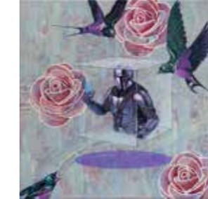
Viktor Cleve, „Arvala“